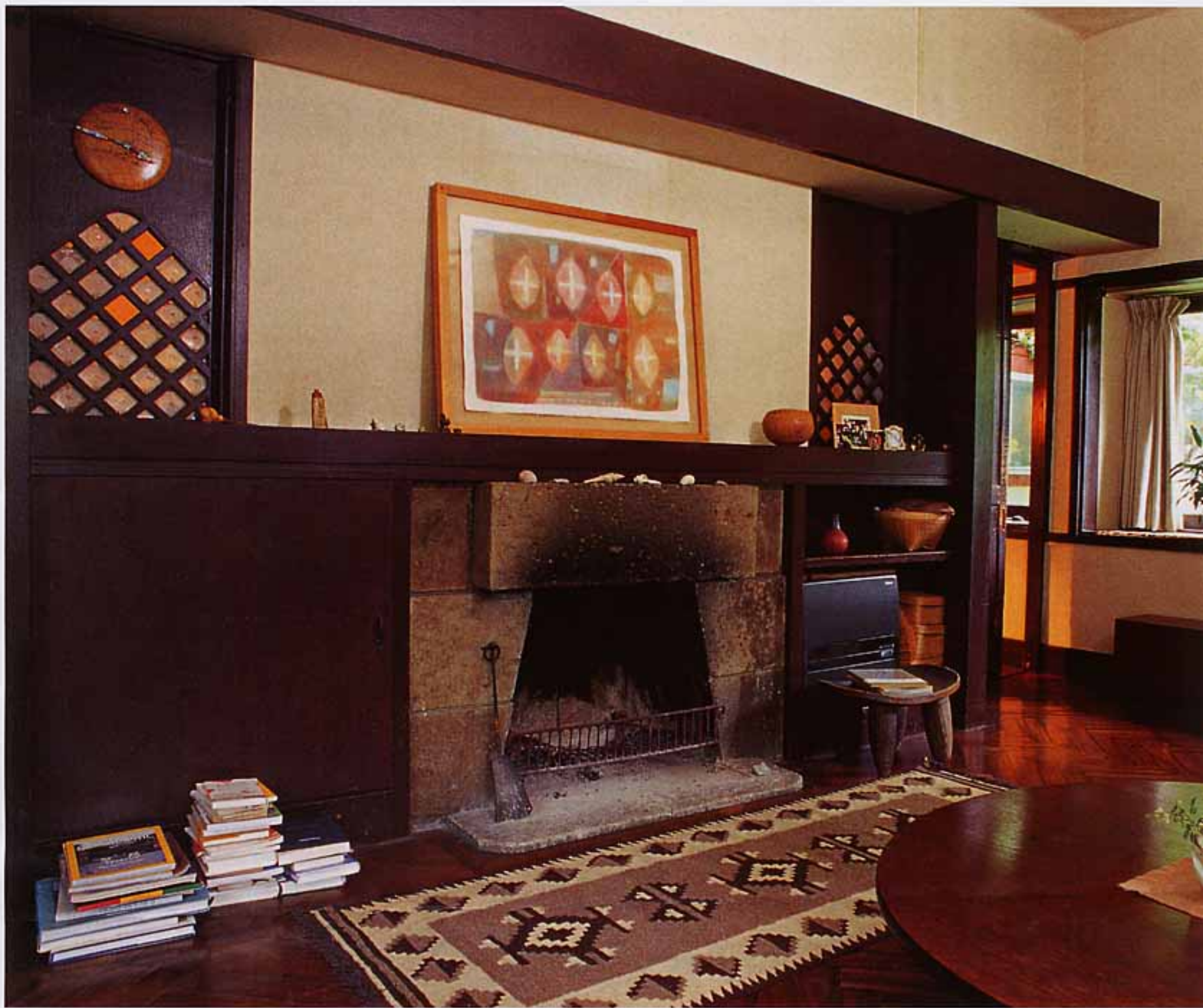
暖炉のインテリアに似合う抽象画。秘められた象徴性が輝きだす。